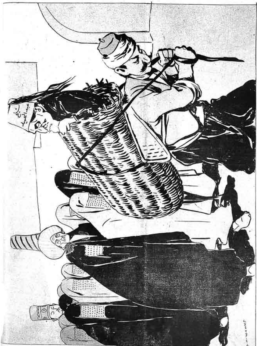
... سلطانم جہنم : ہنس پر اولاد برآمد میدان سوائی قاتلان قریح در ققوز آروا یم بجه اولسون !..