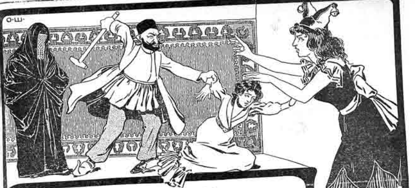
(۱۲) لیلی نمرده دایانیا چانداخ (حالیه):