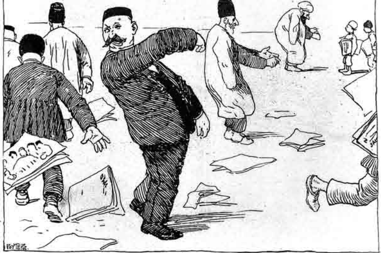
یایخ 'آپار' آپار 'بوده ادنگ کی بر به عمل در .