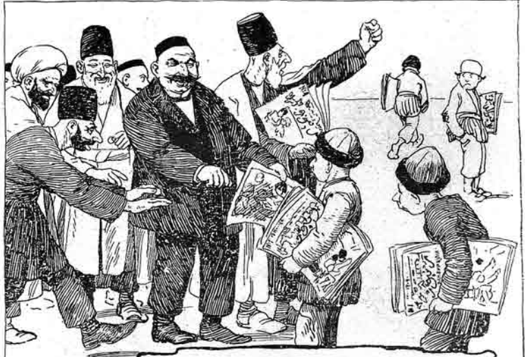
آگیشی ملا نصرالدین زهلمیزی آپاردی 'بر دانه زنبور' گوردن ادویاج

ملا نصرالدینک اتولجی، ایکمچی و اوچومچی ایلی ننگ جلدنیش کتابلاری و بوش جلدلری ساتیلماقده در. جلدلرک اوستنده ملانگ شکلکی و آدی، مجموعه ننگ تاریخی قیزیل ورق ایله باسیلویدر. قیمتلری ادارهده: اتولجی ایلی ۵ منات، ایکمچی و اوچومچی ایلی ۶ منات، بوش جلدی ۷۰ قېک، پوچتا خرچی ایله: اتولجی ایلی ۶ منات، ایکمچی و اوچومچی ایلی ۷ منات، بوش جلد ۱ منات.