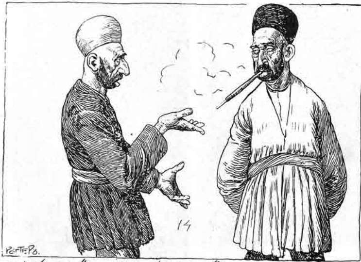
14 پەح پەح پەح 'برده کا مشروط . سکرگین پاتشاہلارک عاشقی بوخ ایدی ؟ اگر بیلسیدیلر کہ شرطہ یافتی زادی — چوخدن ویرشیدیلر ...