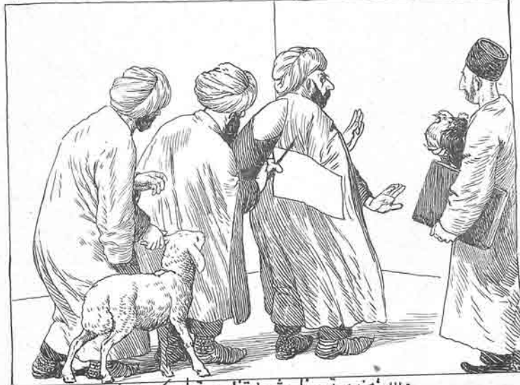
دالله من بر تو بونا شهادتنامه قول چکه بيلمه Нетя, ионя, да одну куряну я не подниму амесетамя.

۱۰ می ۱۹۰۹ ۲ جادی الاول ۱۳۲۷ بازار هفتده بر دفعه چیتاق تورک مجوعه‌سی دره