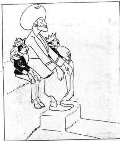
ایندیکی وقت ده