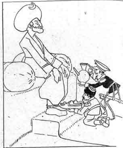
بر آز اول کرده