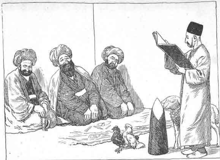
روحانی مجلسنده ملا امتحانی . Engelman in Dуховном Правлении.

افاره و فاندور قلنس، فاندور کوجیسه ليره ۲۳. Тифлис, Давидовская ул. № 24. Roznina zhurnal "MOLLA-NASRƏDİNNI" تيلگرام ايچون آدریس: قلنس، مال‌الدين، Тифлис, "Mollanasredinni" اعلان قيمتی فائق صحيفه ديونت ايله برعتری ۱۹ فيک، دال‌سحيده ۷ فيک، آدریس دويشك حتی ۳ داله يی قيتاك مارتق.