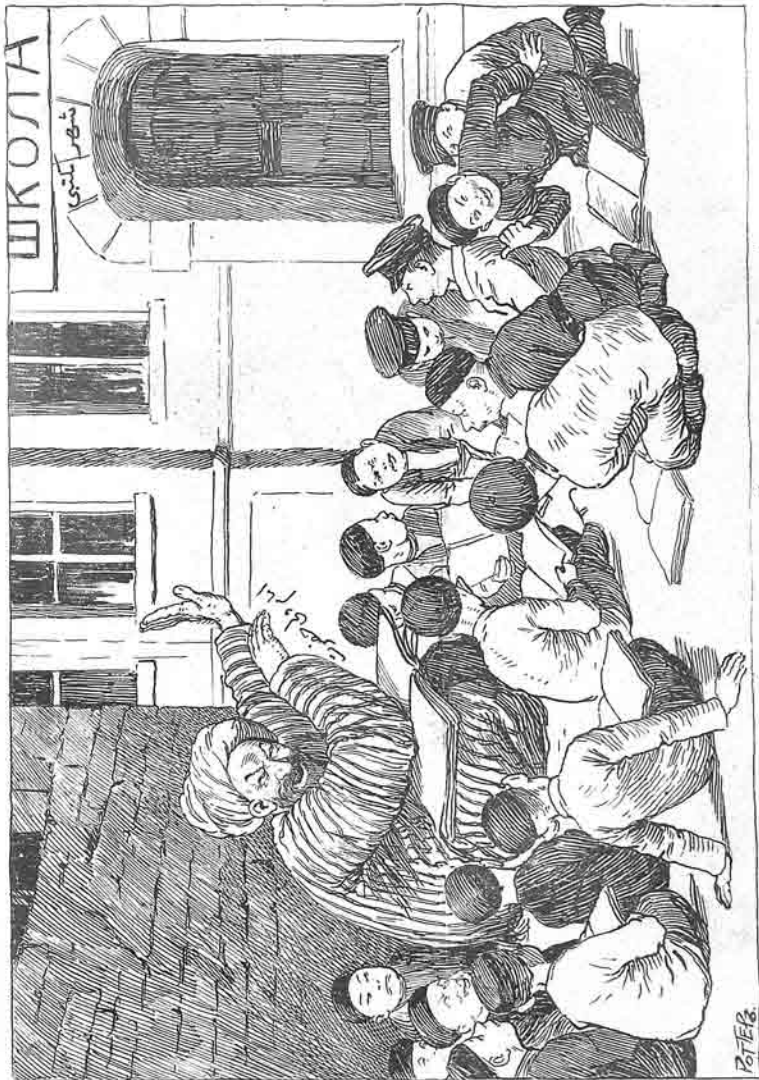
« ادرینوزده برنجی گل امامی ولی حضرت سسلانلاری ایندیروب کشف پوی ایله آچیلان کتاب ده اوشاق اوفتاق حرام در و یونفد نن عله ایشادارین کتک دن کنار ایلبور که ادری اولاری اوخوسون » (وقت) « غازیبه سی نوهر ۱۹۰۷ »