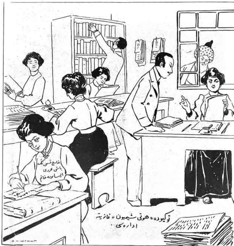
«Тюкюде» هوتي شيمون غازيتہ اداره کی

ЦЕНА на ГОДЪ: За доставку . . . . . 8 руб. За границу . . . . . 6 руб. ЦЕНА за ОТЪЯВЛЕНІЯ: За место заглавнаго строка платитъ впередъ текста 10 коп. позже . . . . . 7 коп.