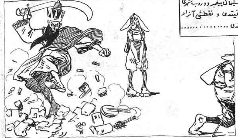
Соломонъ разрушаетъ городъ за игру обитателей его на шахматы.