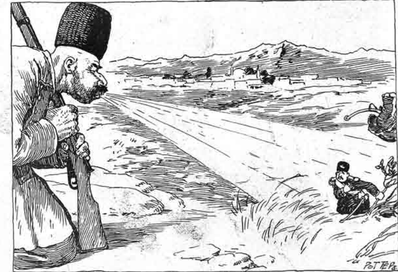
... سن الله یاداش پرفته ... بو یله تاب گورمه من ده جان فالیموب ... Мини, ради Аллаха!