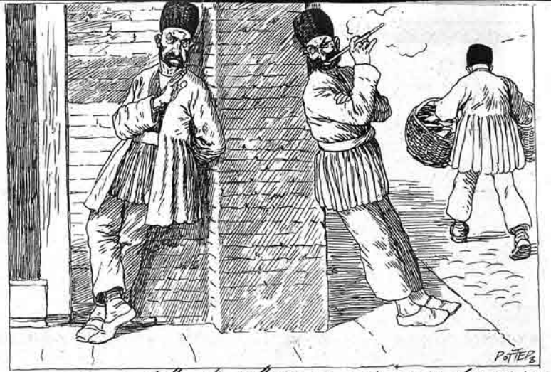
من اولسن دوز ایکی ساعات دوروشام بوردا شغلی نی گوزلیوم کسون گمه ک قبر اوسته .