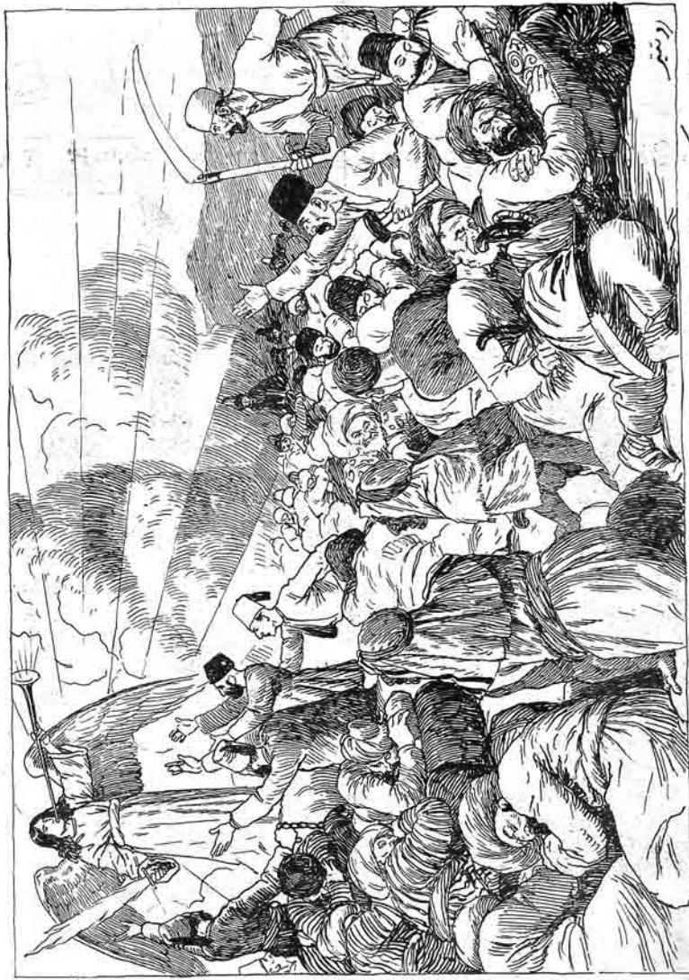
ایستمبر نغمه کا دیبه روی که اسرافیل نور جالی سانه جمع اولی باش تا نازا جا قازار • ایندی رحمت لک ساغ ادرایندی دیبه میم به به هانی ۷