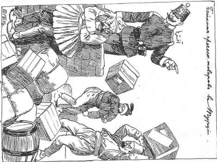
«Бодикоме прелево» модерна А. Мускин.

مىنان درى استىلادى و مەنى زەمە و روس آمېرىقا رېزىن قارشى لارى بىرەدە لېجىنى ماللار مانوفاتوراسى نىڭ پىريورغە «مىخالىجىنى» شىركىتى نىڭ آياق قابىللىدىن اوزى «قىرما» و «ايرىپارلا»