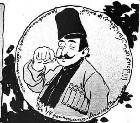
۱۴ ۱۱ ۱۱