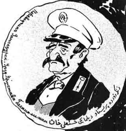
۱۱ ۱۱ ۱۱