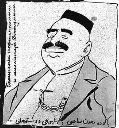
۱۱ ۱۱ ۱۱