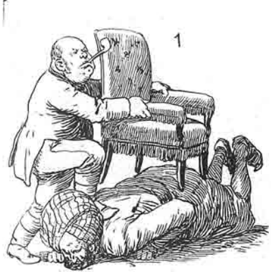
یوز ایل بوندان قیاق Сно ироні томиу пагоу