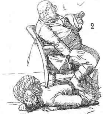
ایندی تک Do cusa nofir