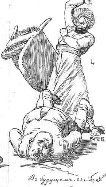
کله جک ده Во будущемъ