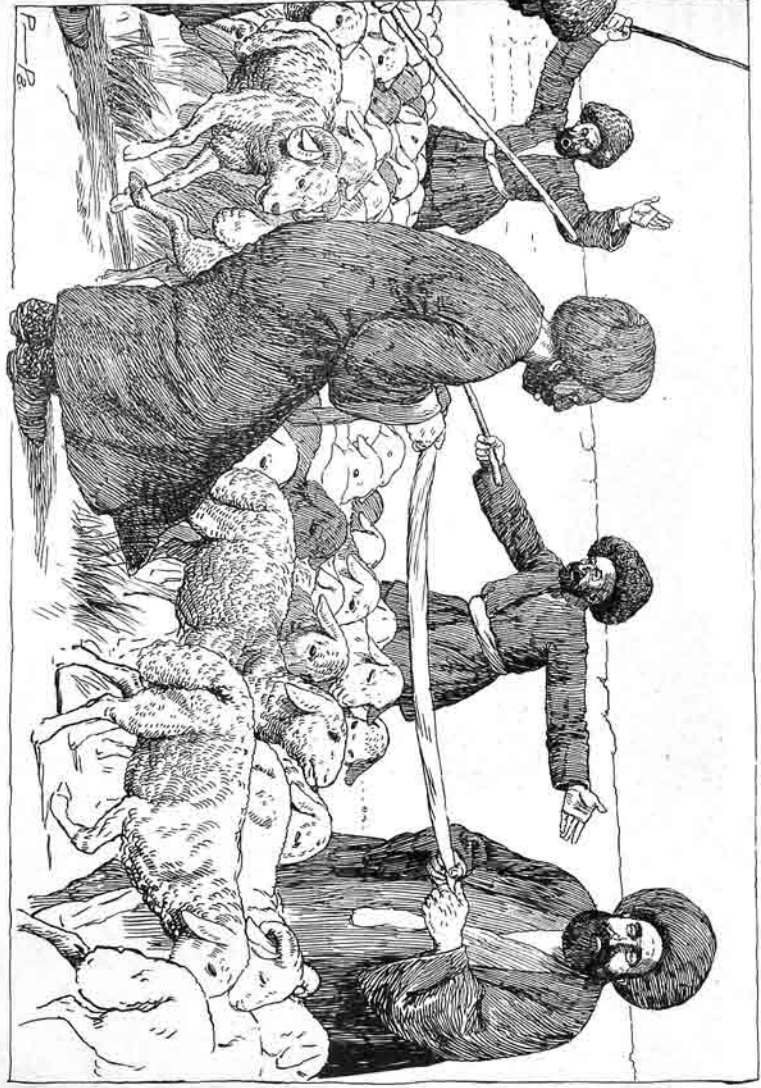
اوردانلی آخ سینک ارجانلاری قاراق بالانده قوریلاری کرکلمش اوتری بیز بیز اور اوز سارک تانیک آتین کیمیزدور.