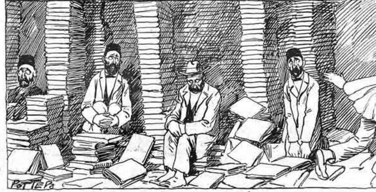
Кому и продать эти книги? بر کتابلاری من کیمه ساتاغام؟