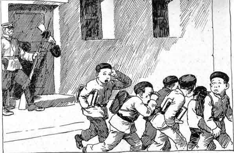
قان-سین آچیلشدر اوغونماق اولنازه.

ملا نصرالدینک اولجی، ایکجی و اوچومی ایلینگ جلدکش کتابلاری و بوش جلدلری ساتیلاقده در. جلدارک اوستنه ملانک شکلی و آدی، مجموعەک تاریخی قیزیل ورق ایله باسلیوبدر. قیقملری ادارهده: اولجی ایلی ۵ منات، ایکجی و اوچومی ایلی ۶ منات، بوش جلدی ۷۰ قیق، پوچتا خرجی ایله: اولجی ایلی ۶ منات، ایکجی و اوچومی ایلی ۷ منات، بوش جلد ۱ منات.