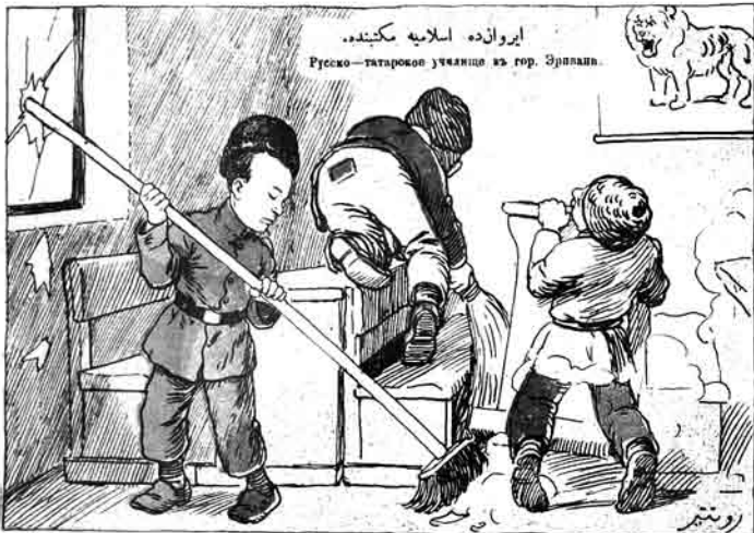
ایراندده اسلامیه مکتبده. Русско-татарское училище из гор. Эрзуран.