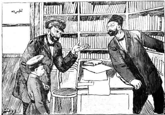
معلم داداش؛ اوردان بر سینهن کتابی ویر؛ مکتب اوشاقلارنه تلیم ویره جم.