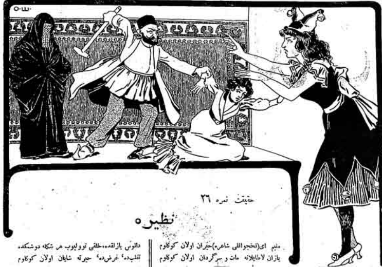
حقیقت نامه ۲۶