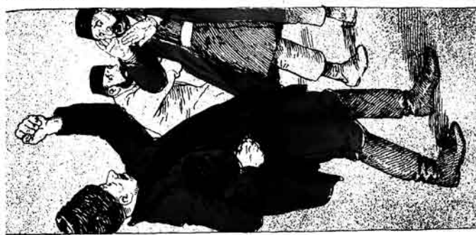
باکرده شهر ادارسی ایسکچی برده Diposo Alimovic