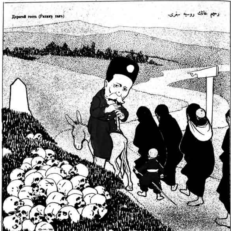
هر كس كه ايستور حرم و شهرت قاتلسوز، متيم تك اوز الى ايه مين باش كسون.