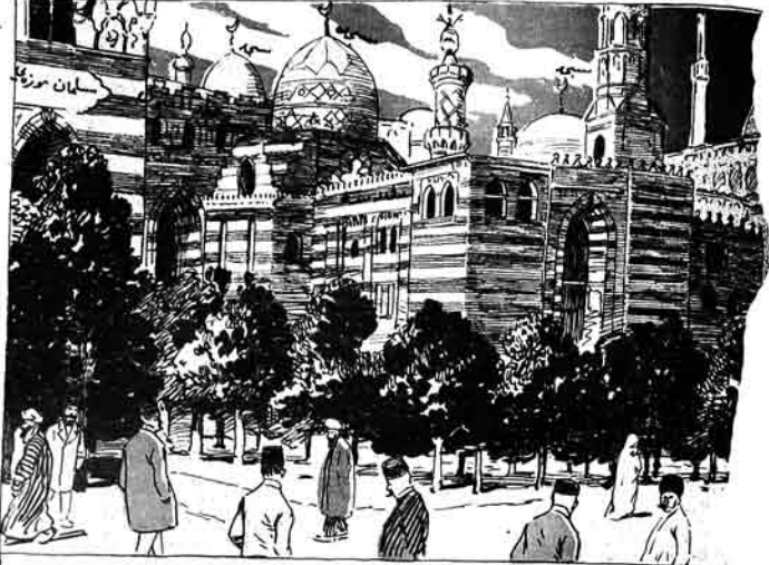
بیترو پورغ ده سساملارک گلہ جگی (اگر بد نظر توے)