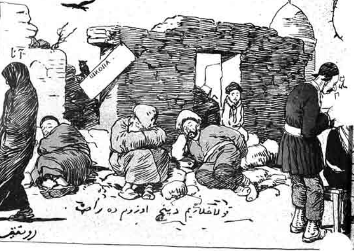
اوسوزی دانیشما کافر اولارسان