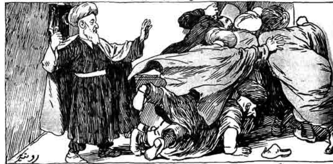
جہاب والی، مگر بورادہ سیزدہ سواہی حاکم وار ک لیلون ایہہ بورورولار ک یو ساعت بوران دایلیق. پئی، پئی، آقا، بورادہ پدی حاکم وار.

ملا نصرالدین واسطیسی ایہہ ایستیلر ہر سفارشہ ۱۷ فیک آرتق بوچت خرچی ویرمکچر.