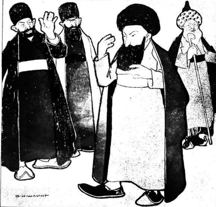
— عز الله بر الصالح اهدو: مگر منیم یا علمیم عامریم بکریم؟