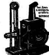
غریبه نو ایجاد...

ایک جنور خوراک ۶۰ تاق ۱ یوقفا عسراق ویرقالل شرایباند، اوج جور خوراک ۷۵ تاق بی ریموقفا عراق بی باقل شرا و بی نمان جنور ایله، دورق جور خوراک ۱۰ مانت بی ریموقفا عراق یاریم شیتہ شراب و نرفمان قوبولید، بیس جنور خورا ۱ مانت ۵۰ تاق بی ریموقفا عراق یاریم شیتہ شراب و بی قلمبان قہوہ. سہان خانہ ساحلری: قورجیللا و سینارولیدزہ.