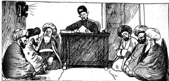
والی حضرتاری: آثارا بر اعلیٰ مسئلہ مکالمہ ایچون سیزی بوراہ دعوت اہلشم.