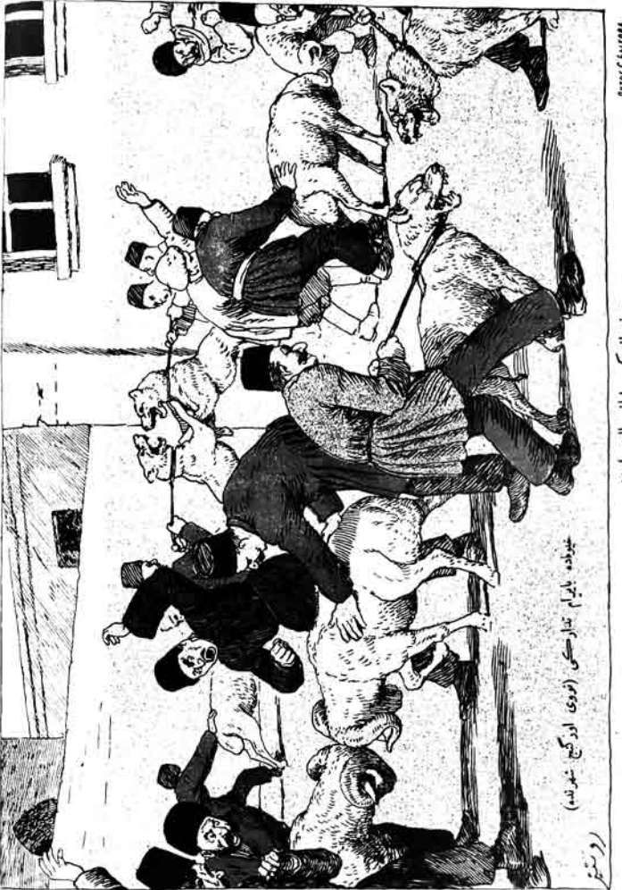
دورمقان كە سىلان پانك اوشىدۇر.