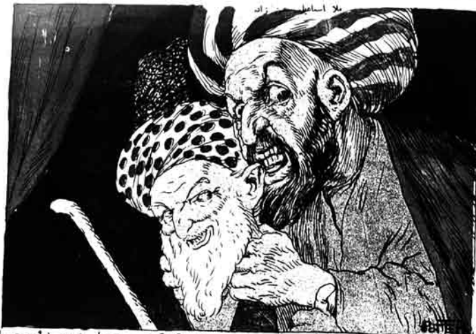
گولدرگ بر گونی ملا نصرالدینک یولی دوشی ولادیکا نقاره میشه لرینه... (سابعدی وار)