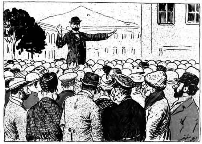
ایرملری قالیقوسک ایرواه گلنگی مناسیتی ایله میقیان ایلیوردر.