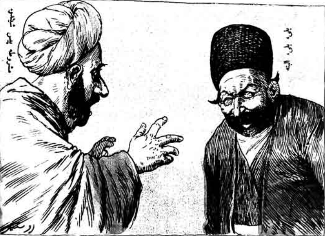
Коллективная - вещь плохая Да, да, конечно