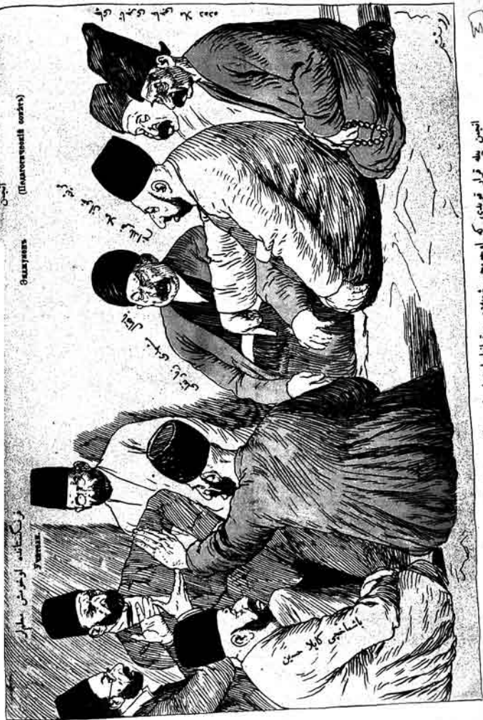
ایچین (ایچین ایل ایلوسونو ایل ایلوسونو) ایچین