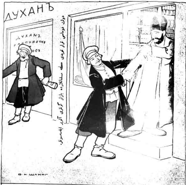
دوك دوماسى قرار قومى كىنە سىللازىدە بازار كۆرۈپ اۆيىر ايلەسۇنلر.

№ 20. Цѣна 12 К. МОЛЛА НАСРЕДИНЪ ۲۰ قىسى ۱۲ فېك