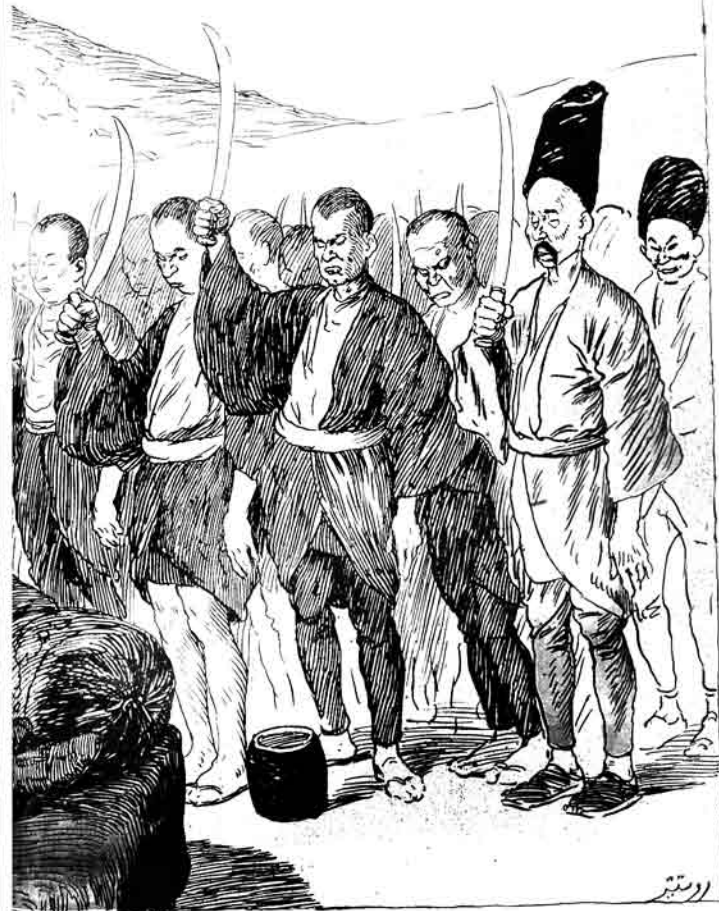
ياپوتيا اسلامى قورل