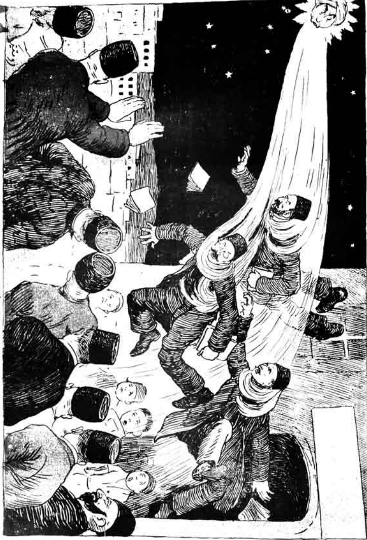
Татарларның җәмәгәт җитәкчеләре (Татарлар) "Татарлар" журналындагы сурәтләре.