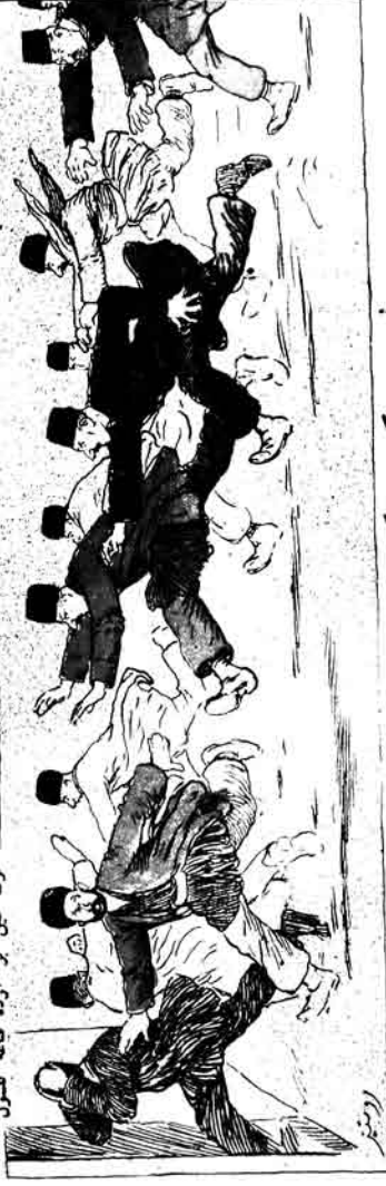
Әле җәмәгәткә, ләкин аларның һәр берсе дә җәмәгәткә.