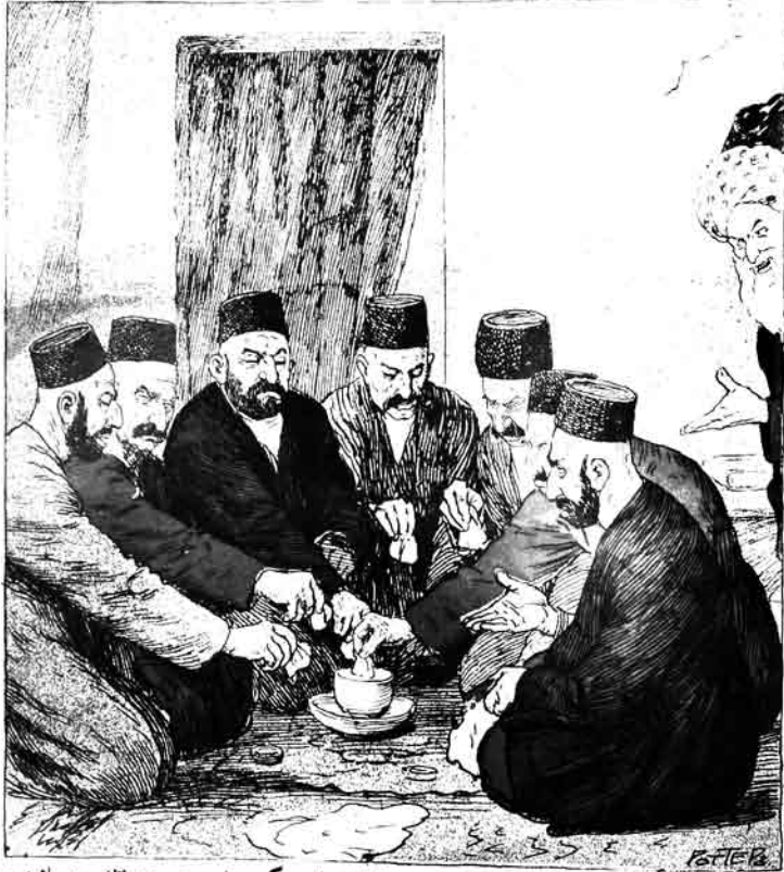
تاجرک منزله قوناقلق آغالاره بوردون، قورخاپون، هامینی کدره، اوج چوریت ائک بوز باشیره، بئده بسم الله دیسک هامینز دویارنق.