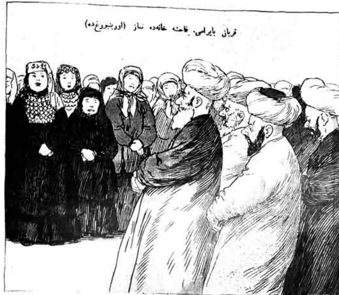
قریان بایرلسی. فاخته خانده ناز (اوربئورغده)