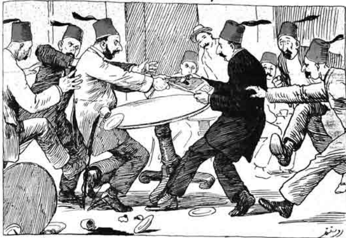
بطوم ايتيلگيتيريك قزئبه هولري. مالورجى دكانده