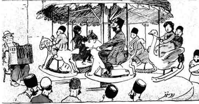
تونسونو ۱۱ رت بابلاده مشغولین.