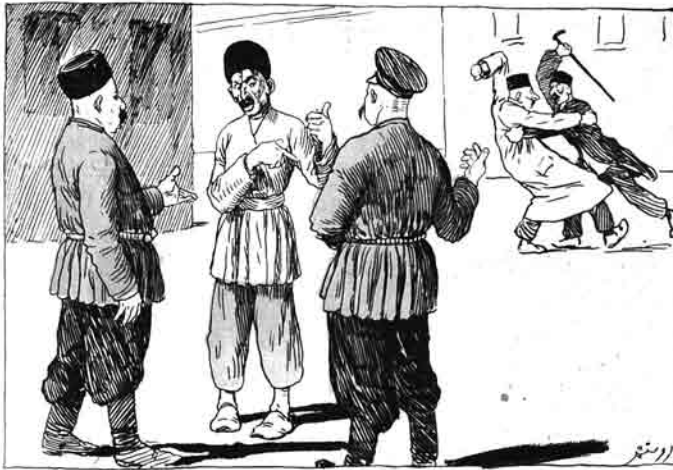
— آي قارداشه بولار نه ساولتير؟ — اوروجون سيني گوريا — واده زناولقون من بر تونكي چاخر ابيديم هيچ ساولشاديم اوروج چاخردان كوجلوردو؟