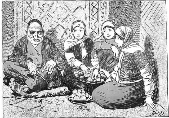
آغداشده بر علاه — گېنم هانسی، دره قېزیم هانسی، آروادیم هانسی!!!