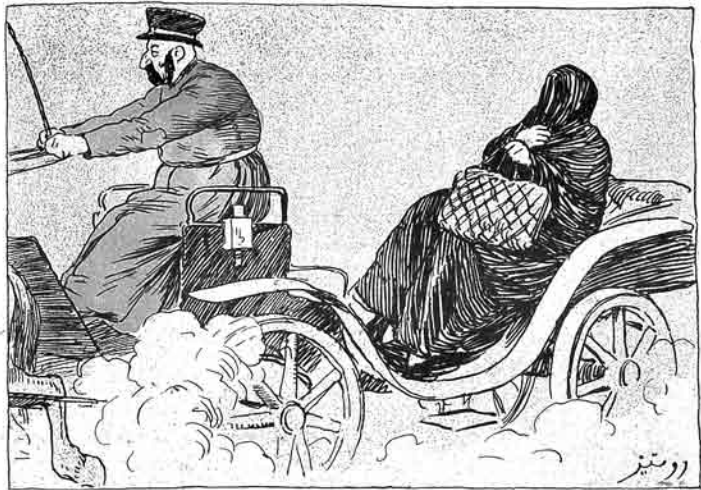
اېروانده گېتازېه کېدن سلمان قېزلاری