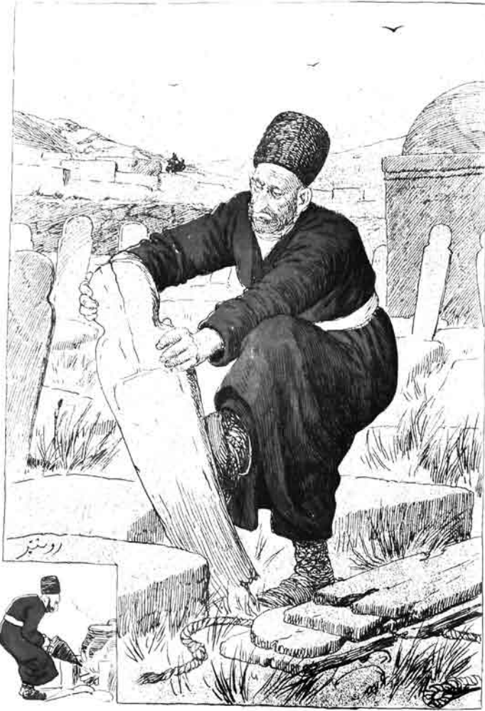
قبرستانقده طله: باش آناجلار تورویانده پاندرماغه باخشیشیر.