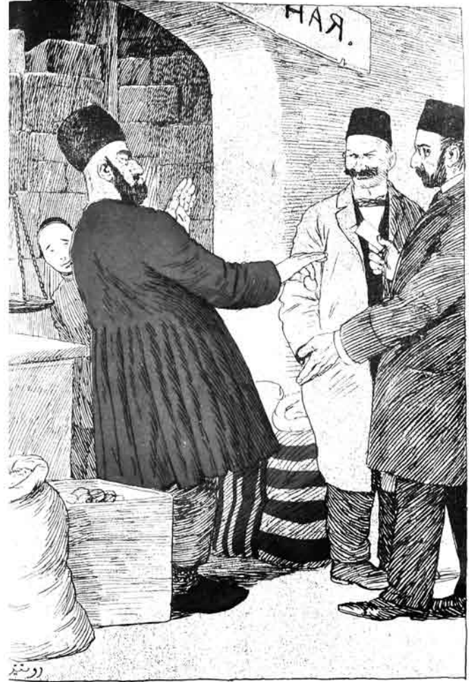
بیلیت ساتانلار - جناب حاجی! پر بیلیت آلون. حاجی مرسل - من بو قرخ ایسکی قنکی سیزه بیه وریرم! ایشاقده منیمبولوم تازاره قست اولماز