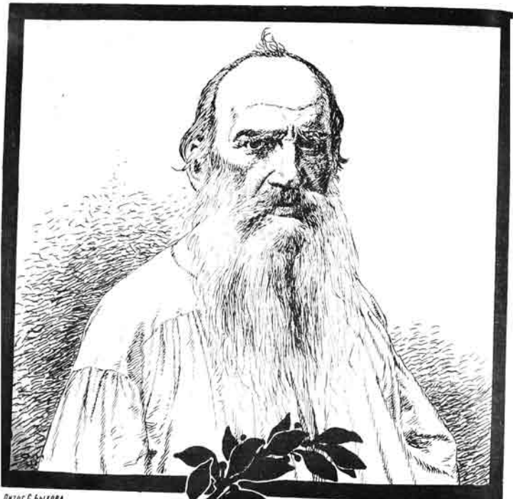
Дѣлосъ С. БѢЛОВА

№36. Цѣна 12 к. МОЛЛА НАСРЕДДИНЪ قیسی ۱۲ قوک ۳۶