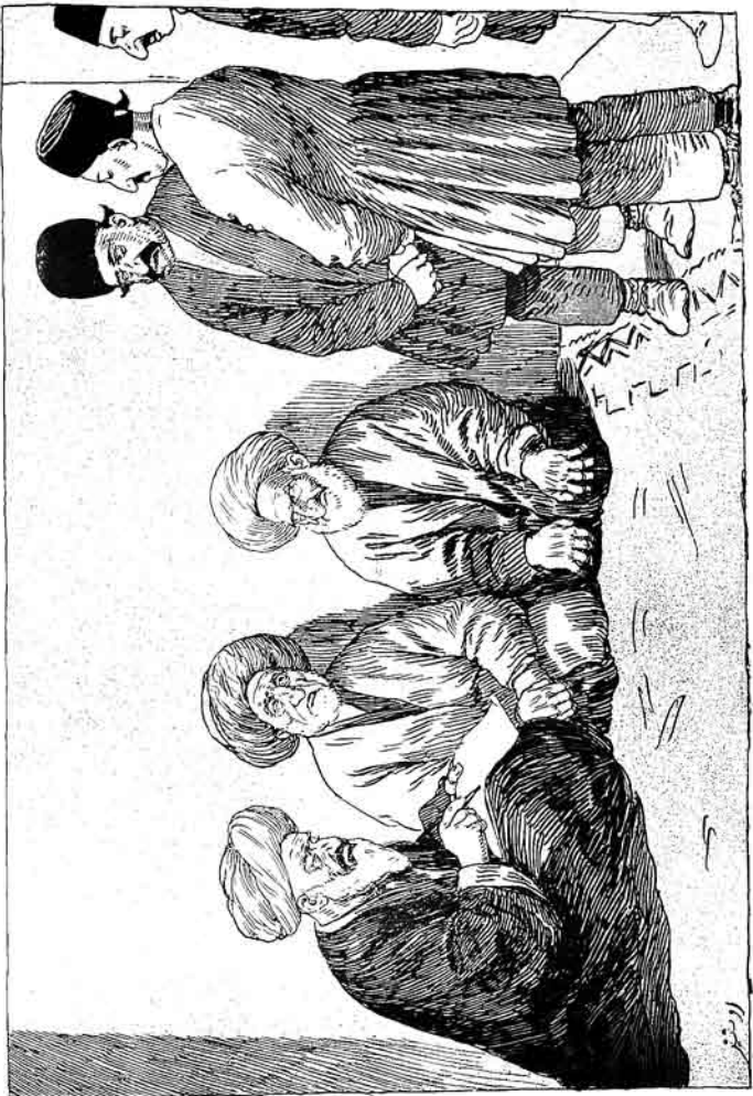
تمیزده شی زاده‌ک کبریه خورا