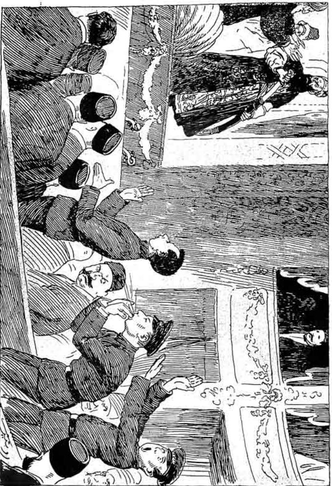
سلطان قیسانطری سلطان پازیرمه