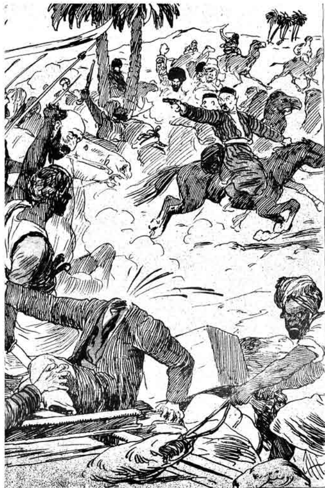
حور و غسان بزرگ خان.