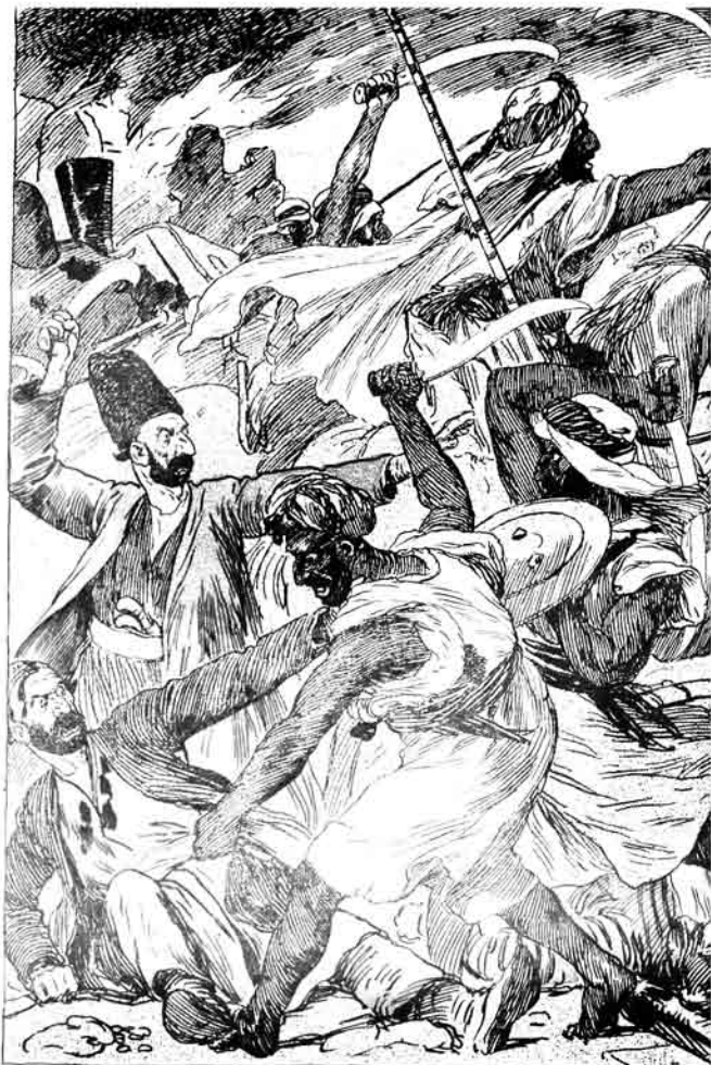
«سك پوله عربلك حاجاره مجوس»