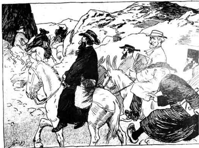
آتاسز قالان بالاری آولامانه گیدنلر: