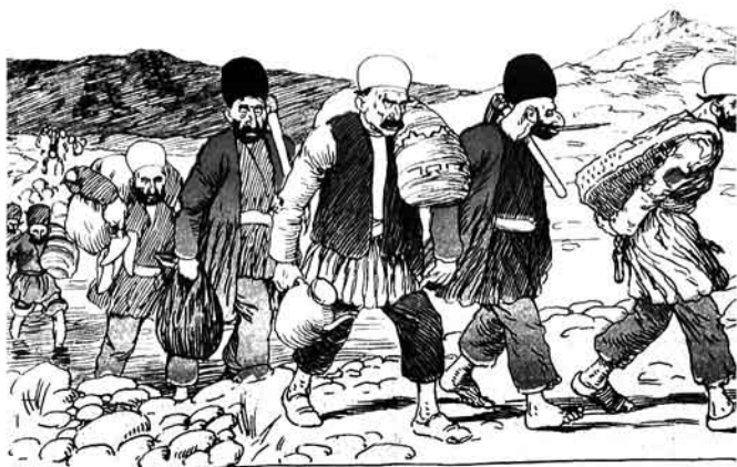
بالاری ایچون روسیه روزی قازانناغه گئیر: