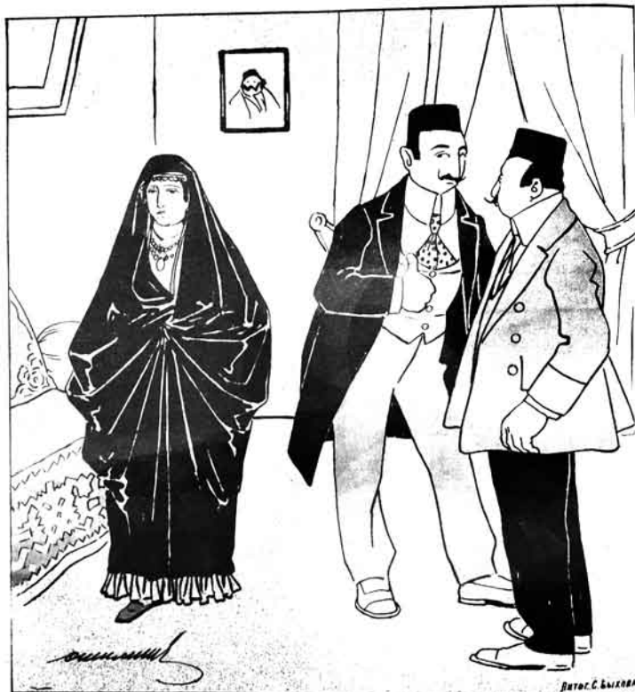
(مابا قیسی همین نرمده)

№ 42. Цѣна 12 к. МОЛЛА НАСРЕДИНЪ ۱۰۲ قیسی ۱۲ تیک