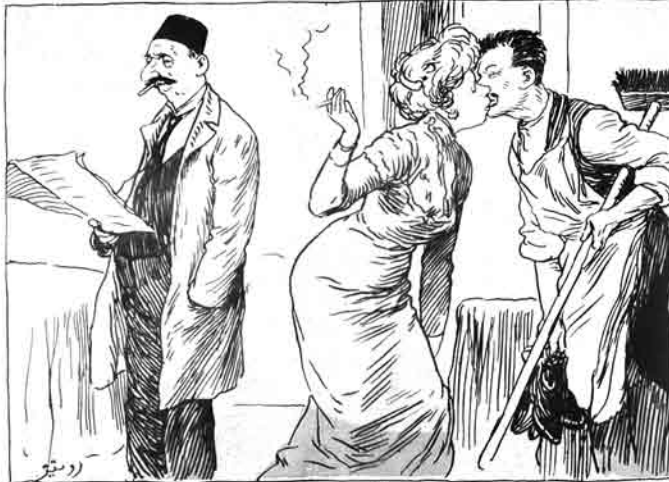
روس خاننی آلاندان صکره قوللرچی بر اولدی.