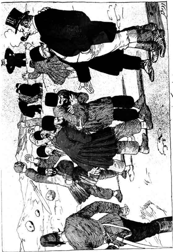
ایران ملکتی ز قورناغلاری فیول.