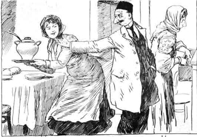
سلطان عدوی اولادغه ابرده قوللرچی راییدی.