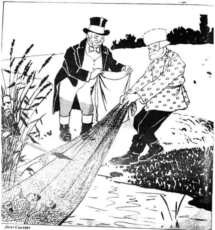
— پاهرا... ابدی رہ قدره ترموم هیچ، به یس تیکانه ایشهره.