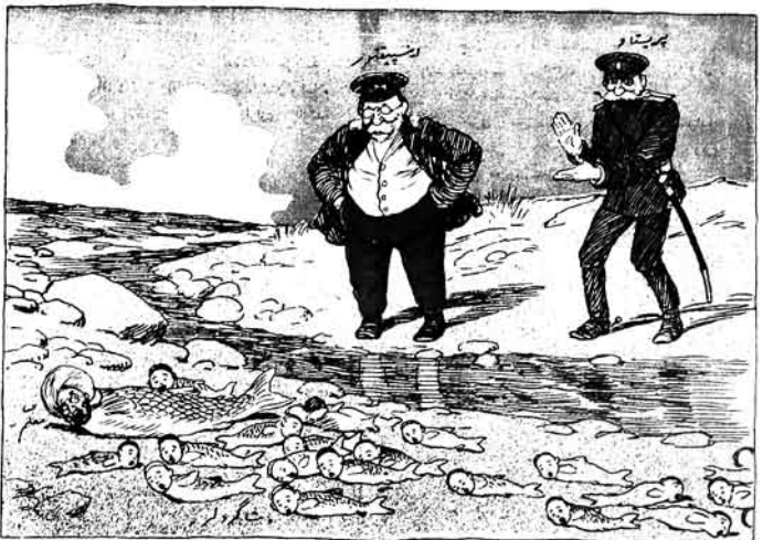
ایسپیتور - ها، باخ سیزک بریکز و جانکز بویه اولمالیدر.