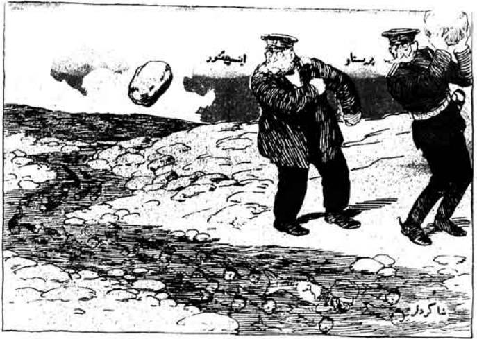
ایسپیتور - اوراسی سیزه پاراماز، چغک دیشاری، اوتقمازلارا