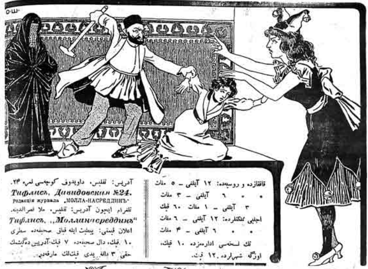
آذربای: قلیبی، داوندوف کوچوسی لمره ۲۴. Тифлис, Диндовина №24. Тифлисе куралла-НАСРЭДИН...

نقاشده و روسیه: ۱۲ آیلی ۵ سات ۶ آیلی ۳ سات ۱ سات ۳ سات ۱۲ آیلی ۶ سات ۱۶ آیلی ۴ سات ۱۲ آیلی ۱۰ قنک، شهراره ۱۲ قنک.