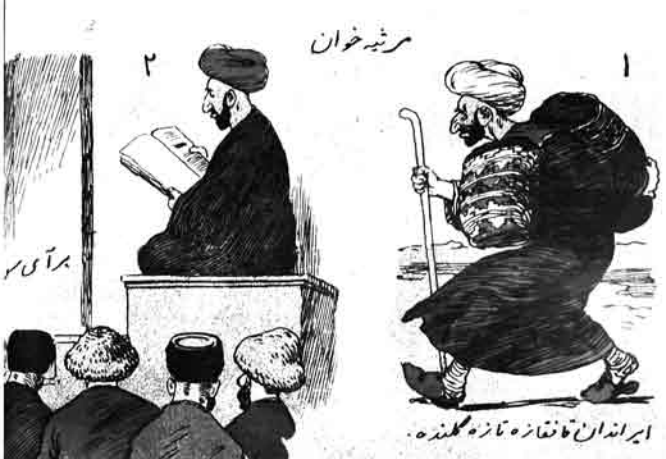
ایراندان قافقازہ تازہ گلندہ.