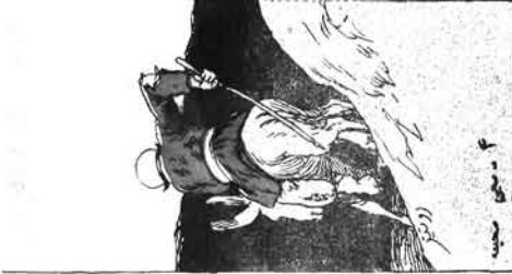
۴ - سجده ڪيو.

هر ڪم دنيا ڪري. هر ڪم ڪري. آجڪل ٻوڙيهه ڪري. الله آڻي. هر ڪم ڪري. هر ڪم ڪري. هر ڪم ڪري. هر ڪم ڪري. هر ڪم ڪري.