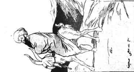
۳ - سجده ڪيو.

هر ڪم ڪري. هر ڪم ڪري. هر ڪم ڪري. هر ڪم ڪري. هر ڪم ڪري. هر ڪم ڪري. هر ڪم ڪري. هر ڪم ڪري.