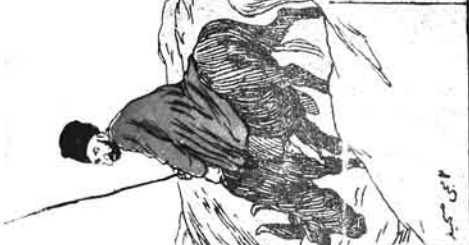
۲ - سجده ڪيو.

هر ڪم ڪري. هر ڪم ڪري. هر ڪم ڪري. هر ڪم ڪري. هر ڪم ڪري. هر ڪم ڪري. هر ڪم ڪري. هر ڪم ڪري.