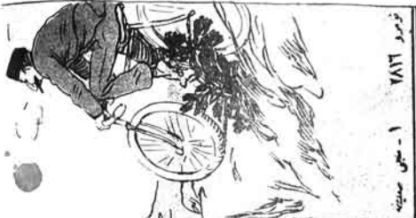
۱ - سجده ڪيو.

هر ڪم ڪري. هر ڪم ڪري. هر ڪم ڪري. هر ڪم ڪري. هر ڪم ڪري. هر ڪم ڪري. هر ڪم ڪري. هر ڪم ڪري.