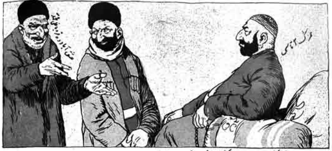
محمد - آهنگ امریه عزیزک اولوم نهموره ایستوروم