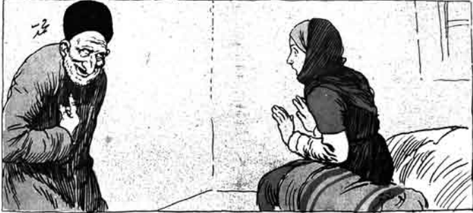
سادهان آلم، منی قرجه جان ایله! ... (زنانف گبوس)