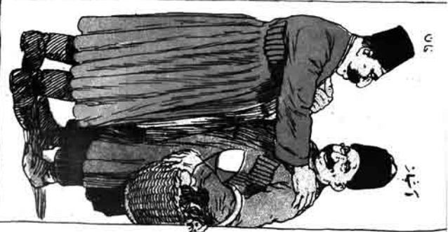
قریشی عقلی بیلیم، اندوزک ایز بیلیم، سلف کیمی یکر آرزاهه اکن اینجه سادولان ایستورم، بیجیم با دنگلی ۲۰ حالت دوهه بیلیم