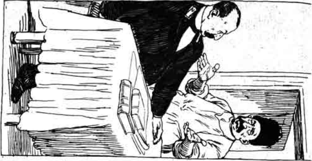
آهنگه گبوسکم دق دوهه بیلیم چله