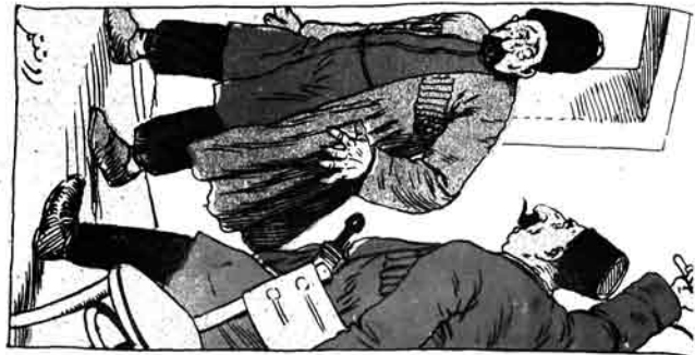
اینتهم اول ا ۱۲۱ شامندن آرتق دوهه بیلیم