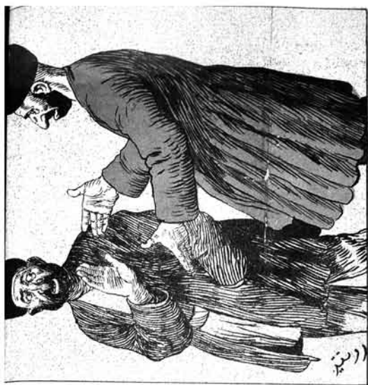
کابلی ! آستنده آنا کلامت ایلسون ارمونک آقام دیمردیک