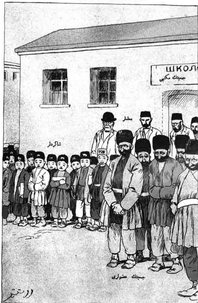
ایران جهت خیریه