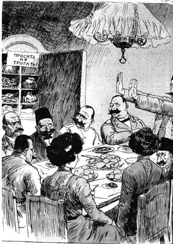
— балам, بس يو نېبه ايلده سونگ مېكتىز هان؟ — انشالله آچيلان آيك بلشده آچاييق.