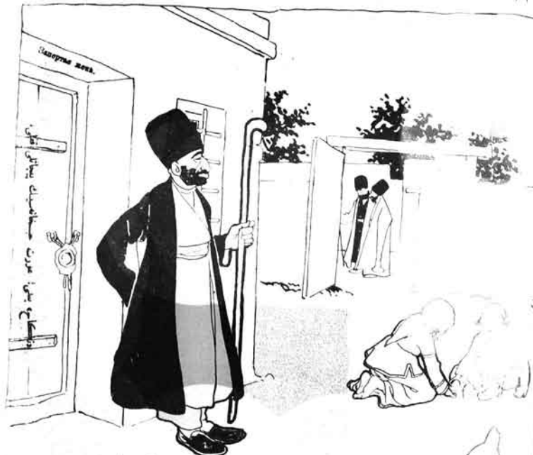
قویلیانام چولہ جہانگیر، کتھر، گوررور، — Не за что не выжму я те мужичим ухватить.