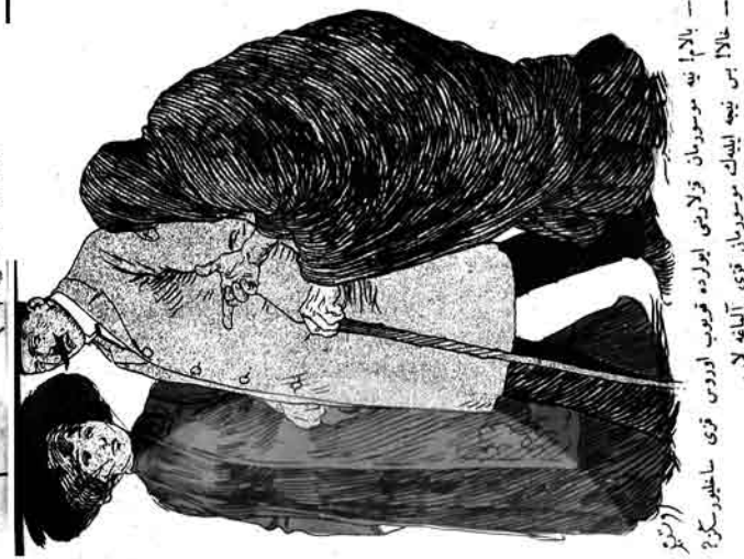
ایکسی عین منک مات بمل لایزده او برلی بنانا کیسی تندیگی نه مدگر حالا بس نینه لیبیک موسومان قوی آناهه لاپ بالام نیه موسومان قزایلی ایرلده قویوب اودوس قوی ساغلیبرسکر؟

غیرلرک باسکولریه یولی آدم سرگک ییزه من دیوروم بو مستنک هر کیسی اوز وظیفسین ایسکی عزیز محترم یهدالی بوئی گورن کیسی الحسار اول وجوددن نون-سوی هر گجه گروب قوردا گلشنه آی دالی خنه گلشنه آی حارای چوللیجه نا خلف لری شاه-تولیر ایشیدیلار تانه هوراییلی ماسی جمده جاتور سکیمی آخرا لاسر مخته مراه خارلار اولوب تام قارا دورت کره دوقوزک عسی چله وفات ایدوب اودم برده آچار بوجوفتنک بورغایریش، یوگورمه یورت دومدا دیورن نه خیزی وار؟ حائسزه یانان گلوب یاختیمی وار، یاشی وار یلنگه گور حاجان گلوب آدلاریک یاریسی حاجی سجده یوبیلان گلوب تولسی کیسی دینیکدینیک طلوبلاری بوغان گلوب شیره، گلشنه آی آغا هر یالا جیشتلان گلوب السه قلوب مهاد ایسه چوخلی یلان یلان گلوب سکال استها ایسه گور نیجه قایلان گلوب اشه گوریکدی ماحمل اللی نثر سایان گلوب ایسکی دنی اوسته گل یاشه روح خان گلوب خاس نیراش دلالسکی میدانا آت جاپان گلوب سقیه خاسر