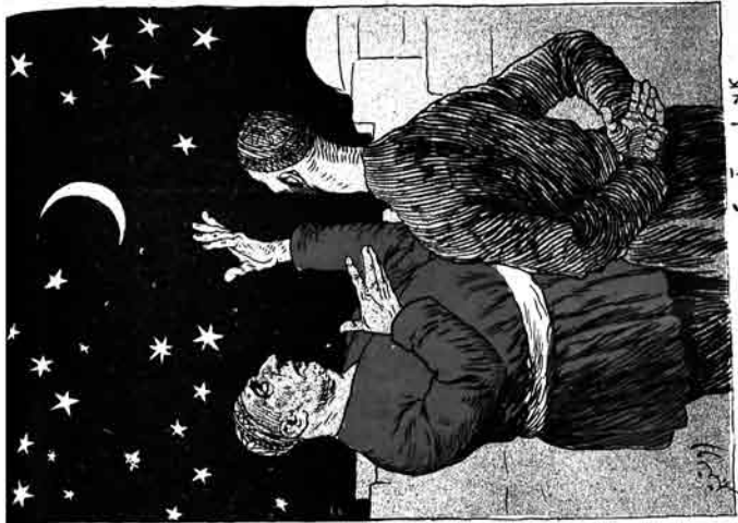
په انیشتیم که گوزل اوشاق اوزینه باغزارلار کابلجا، بو آی گورسن نه اوزینه باغزارلار