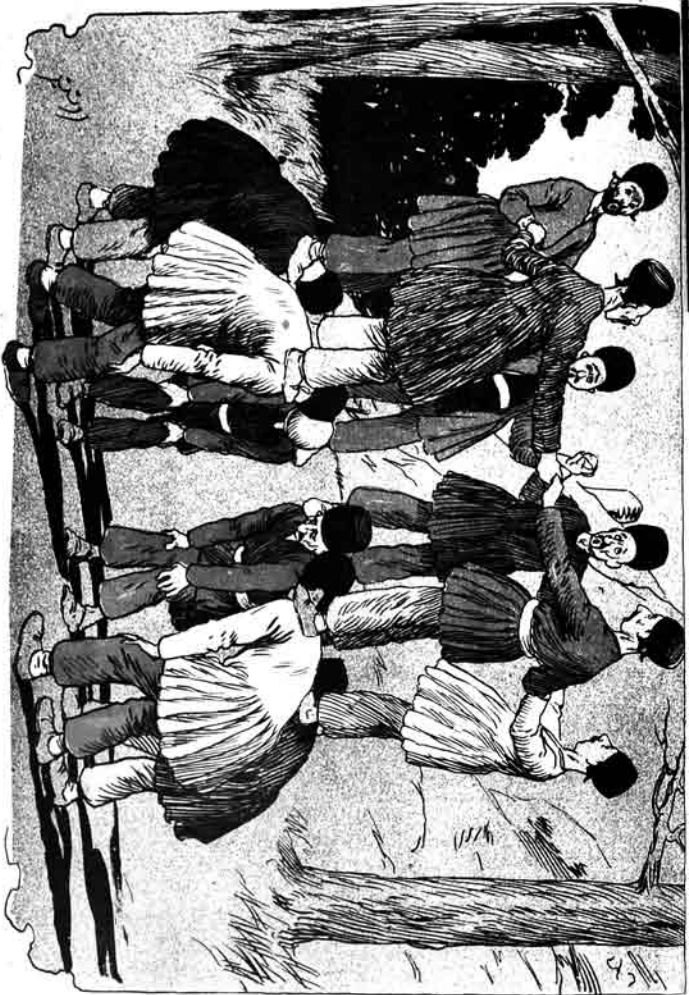
تلفیسه باغچهسکی باغچه سیرتارک باغچه سیرتاری

تایا بیلنبور بو زسده سوزیمی مرست قالان یازیر هارا گو نمریر چاپ ای دینبور نه که آشکار لهان یازیر بورا سودی شغالی کارینی ها غزل یازیر، ها هالان یازیر