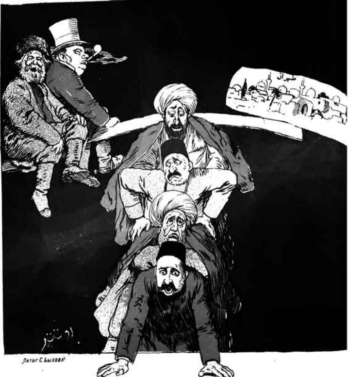
(مشهور مهندس آرغىنىڭ سوزى)