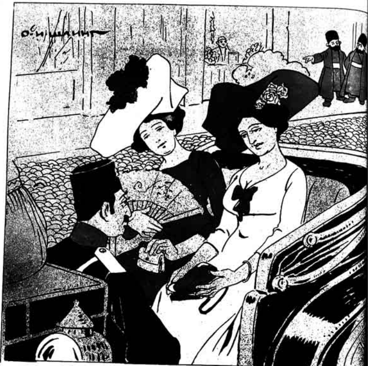
— بیر قونسول که روس خانلاری ايله فایرنا مینه، داما اوندان نه گوزلک اولار؟ ایرواندا ایران قونسولی

№22 Цѣна 12 к. МОЛЛА НАСРЕДДИНЪ ۲۲ قیسی ۱۲ بیک