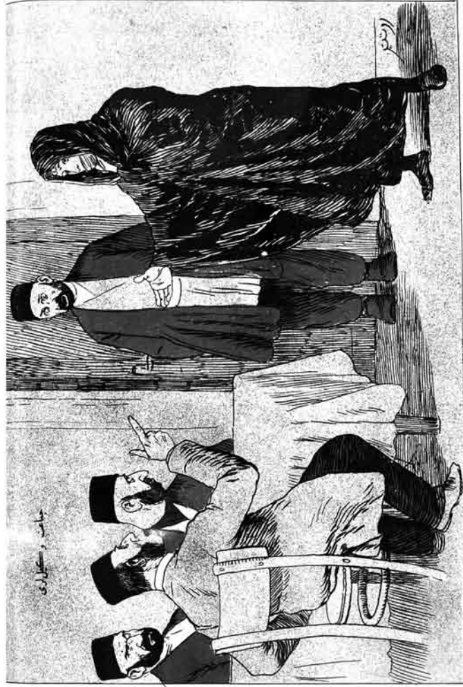
جانب و سگباری