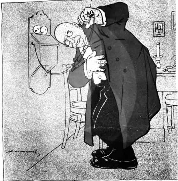
Рахъ стараясь, Ваше Превосходительство!

کنجده حکیم باشی، تاراخ توروخ، تیلیفون ايله غوبرناتورنان دانیشیر. Губернскій врачъ Тарахъ - Турухъ вызванъ Губернаторомъ къ телефону.