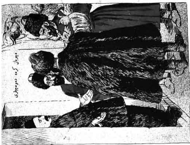
— قربان اولاق سگا مسجد، ییز سنی تک قوباروق اوره گئگی سینما که شیخ الاسلام بوردان کوچدی.