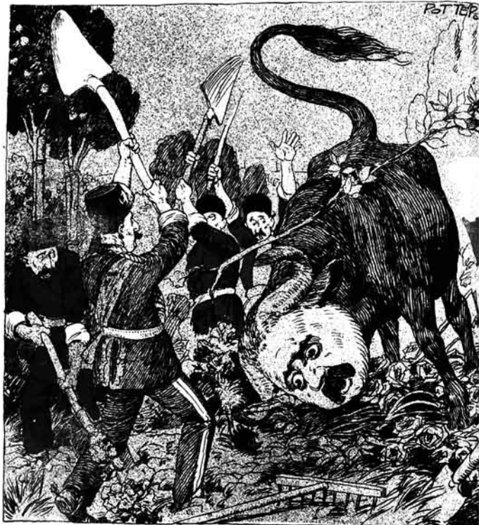
آى ھاراي! بو آللک حيواني قوريبک، يوخسا نورس باغزى بوج ايدھچک!

№27. Цѣна 12 к. МОЛЛА НАСРЕДИНЪ ۲۱ قيسى ۱۲ نيك