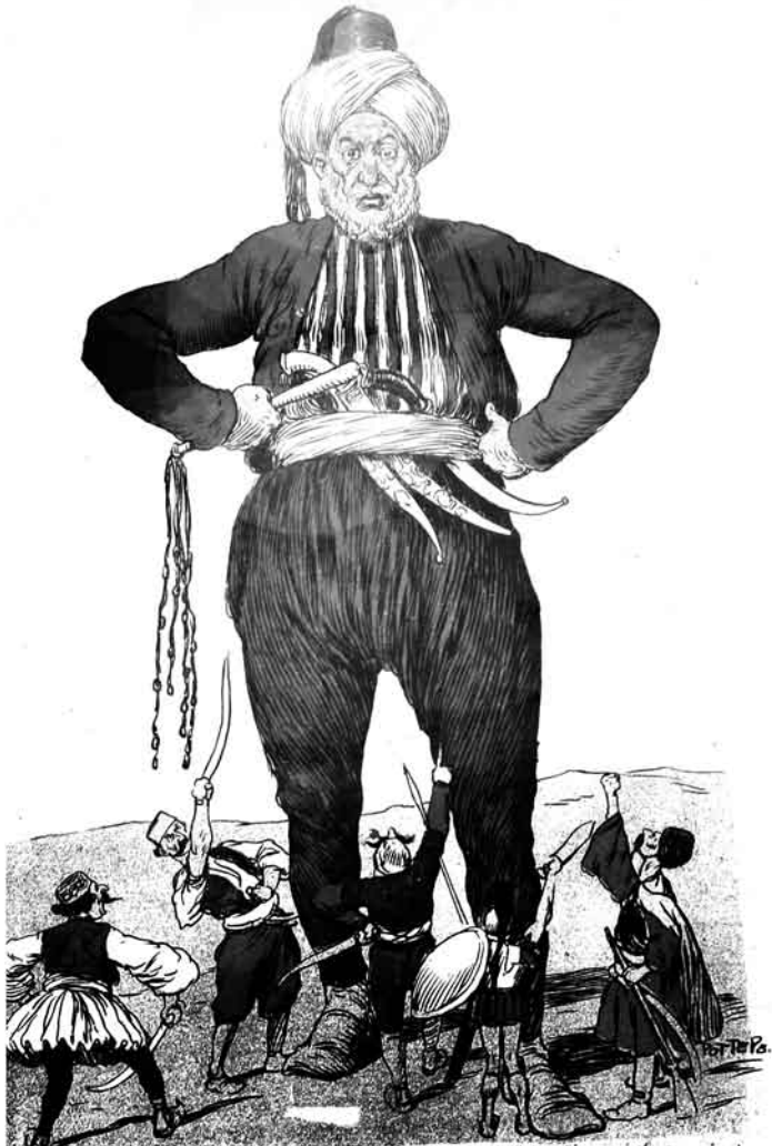
بر خردہ جہ آد املاری بیر تیک ایله ازہرم. اما قور خورام قونشولار تیکمک سنہ قور خالار.