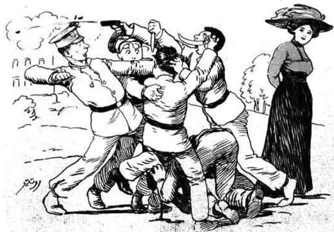
موجور، یالانده مسلمان کینازبسترینگ مشمولتی.