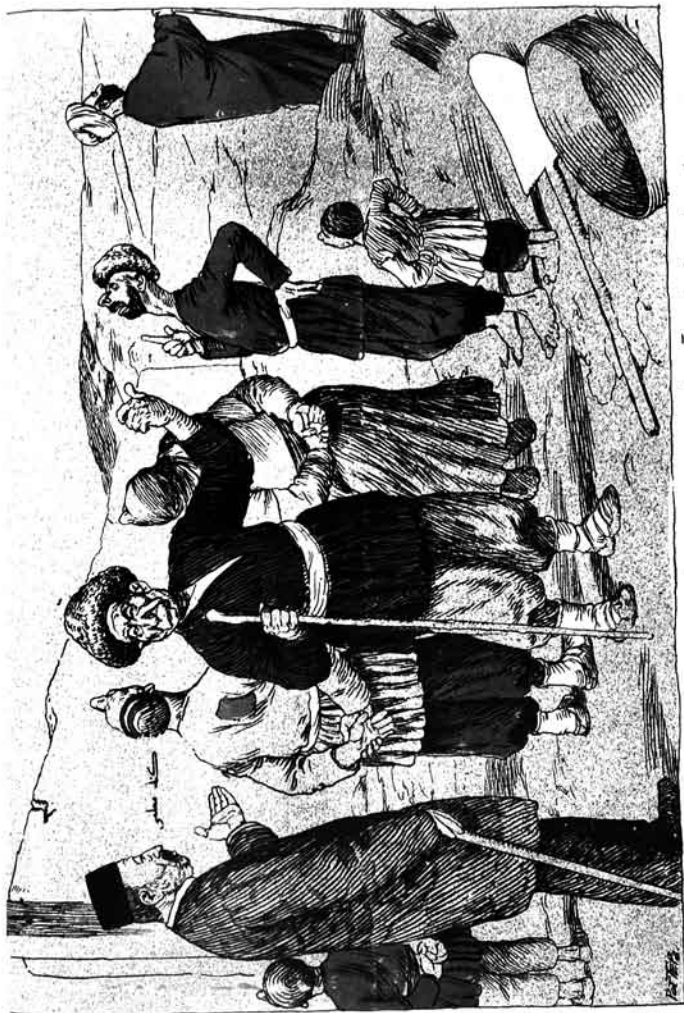
معلم ... نه سیه لی مائینی آکوب ناخلی مائین ایله سادیریمیرس؟ آخوند ملا فرمضالی دونن سجده بیوردی که؛ مائین زاد شیطان صلیدره اناک برکتی قاپیردار.