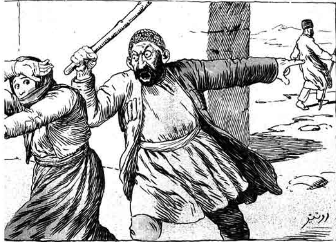
— آئی کویک قیزی! سنک بیله آتاکک گورشی . . . شهیدی محمد حسن نیه بوردان کجیر؟ هه، بوردا بیر اینر رلر!