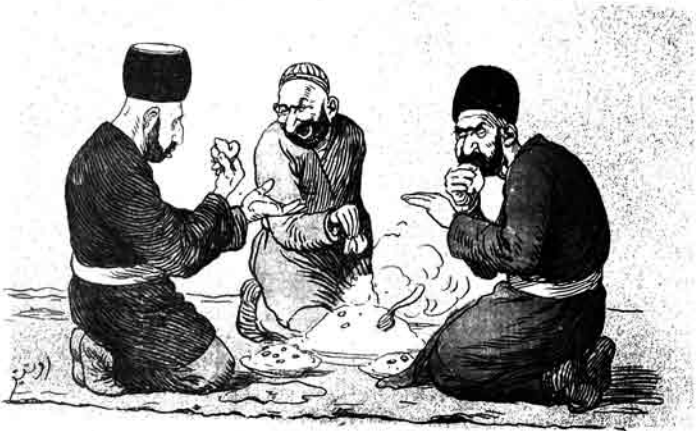
— بالام، شهیدی غلام حسن! من ایله قانیرام که اوروسلاز خورگی اونداق اوتری لری ایله پییبوب، قاشیق ا بورلر که ییلدیر لری مردارد.