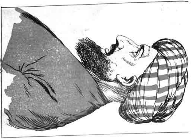
سائیل قاسمی، ملا علی محمد (امین): حاجی لار، سیمه لورن، آلال سیمه لورن... Buzakare nazim, a qasmi... Buzakare nazim, a qasmi... nazim, nazim...