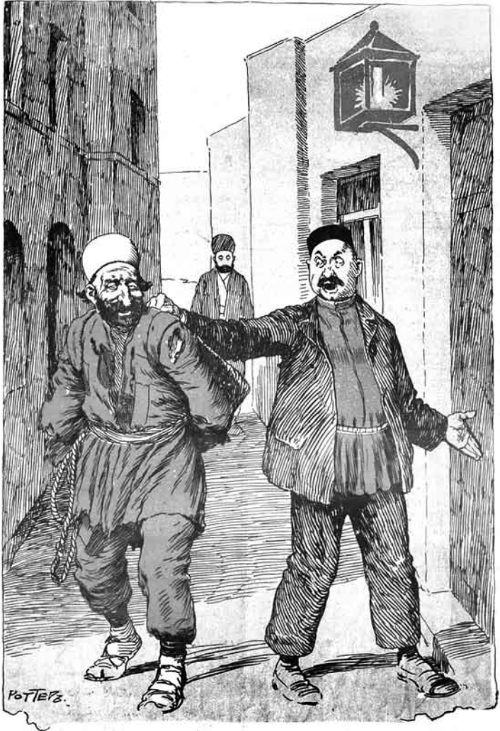
تیز اول، یا کیر ایجری، یا رد اول، کوروب ایلین اولار.