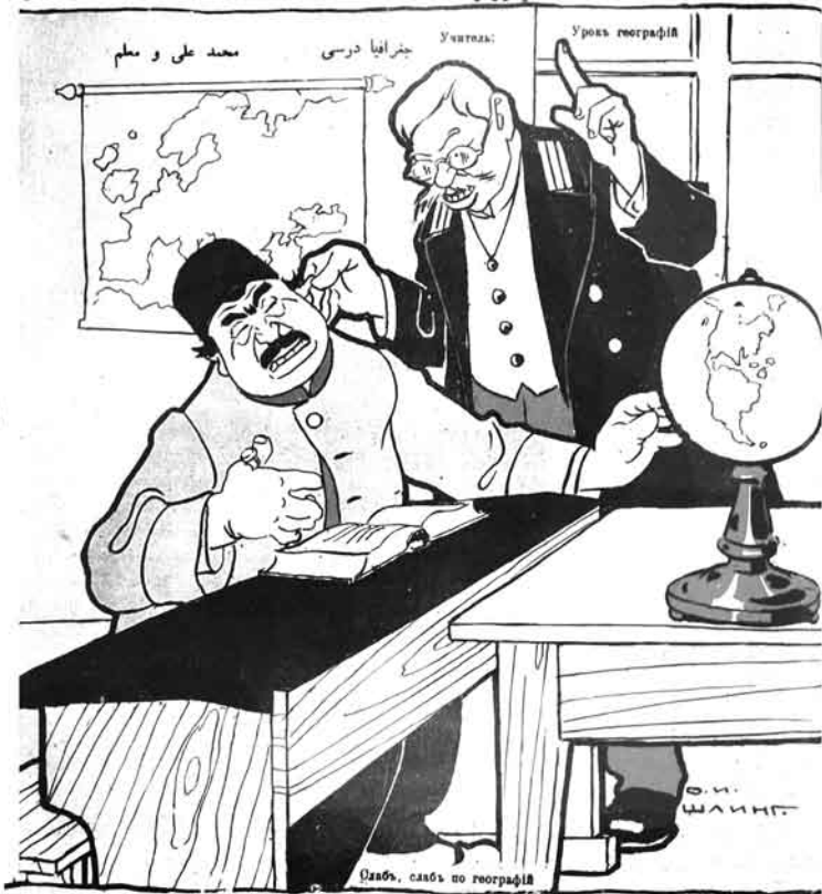
آی قریشال، هله ایندی به گیمی ایرانک یرینی اورگنیوبسن آی قریشال!..

№37. Цѣна 12 к. МОЛЛА НАСРЕДДИНЪ ۱۲ تیک ۳۷