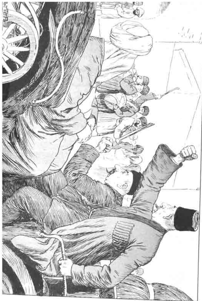
دی سیرلان چالین، آئی سیرلان، چالین، یزیم نیش، ملازی اور سائیکان سائین، O, vraga spoznav, so ostopiglavne Samanentits 7mad namero 77140