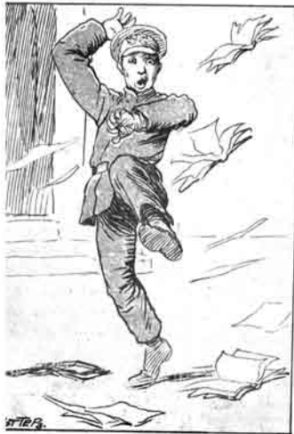
درس دن قورولوش میدان اوشانی

آکیش، قاضی مزی مذمت ایلبورگ که رشوت آلیز: به بی چاره ایکی ایرینی نه ایله دولاندیرسون؟