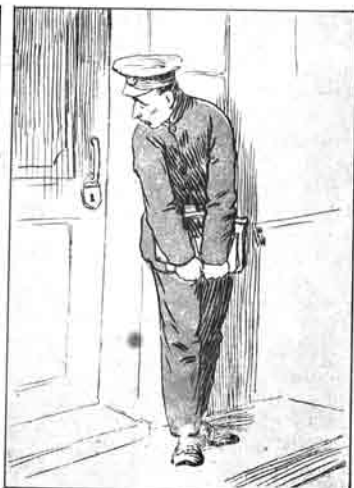
درس دن قورولوش ایرینی اوشانی