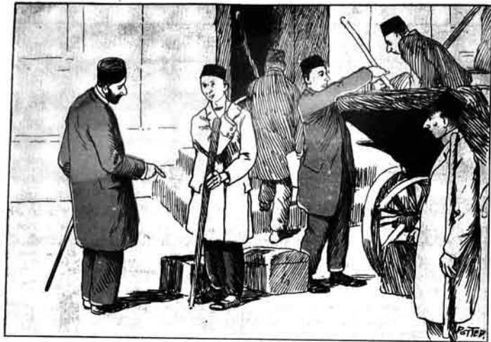
مسلمان آرتيستاری — احتیاط ایچون آغاچلاریده کوتور: بلکسه سوزومز چپ گهی. Съ шпалки, на всякій случай, можетъ быть подорожи для революціи