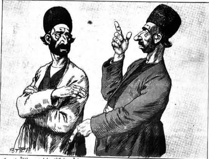
— مشہدی محمد جعفر! بر ایتالیان دولاستدن عاقلگ نه سکیر؟

— بالام، هر چند که عثمانی دیلاره، اما آدمک گه قانی قابیرور . . .