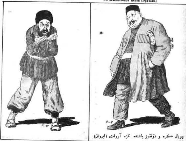
چوبان کوره و دوقوز یاشنده تازه آروادی (ایروان)

آند اولسون الله، تیارده اورتیان اوزی آیین مسلمان آروادی ایله گزن ایروانلار ایله دوشمهله، قانلاری