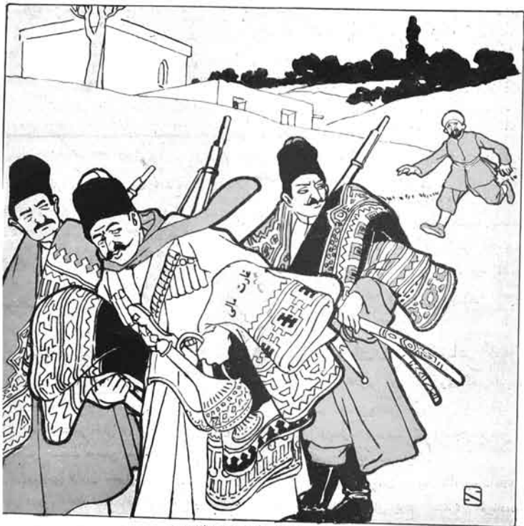
ایراندہ قافلز دیسوقرالاری "Сопіал-демократи" (Порсія)

№ 45. Цѣна 12 к. МОЛЛА НАСРЕДИНЪ ۱۲ قوب ۱۳۰۶