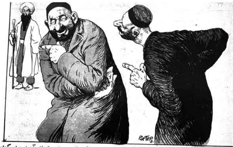
— او نهدي ايله گيزلين آباريسان؟ — مسلمان غازتسي در: دونن قاسم بك مسجدنده دانيشان آخوندمزدان گيزلده