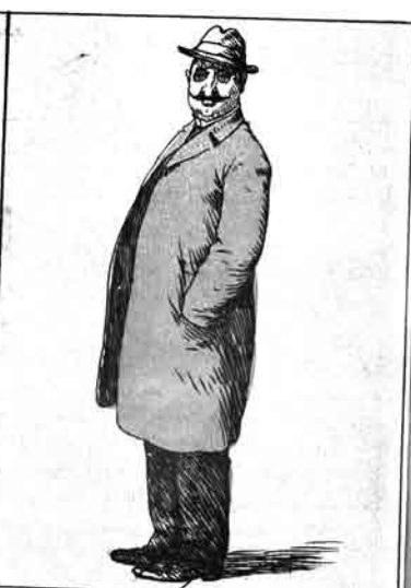
ايتتلكيت مسلمان ساير وقتده