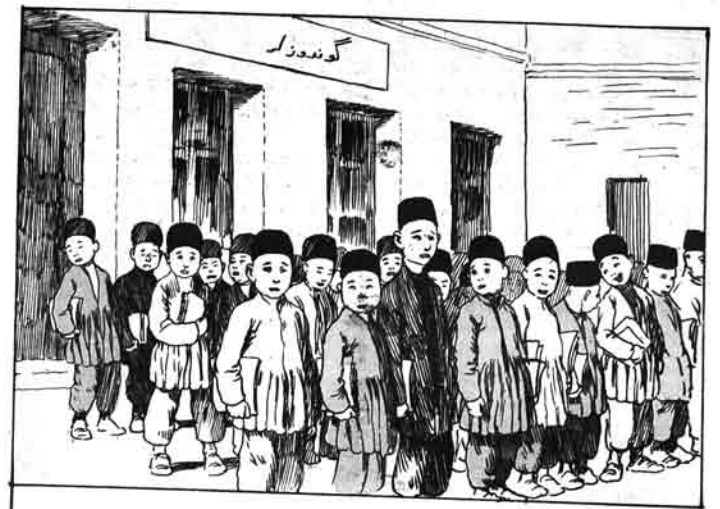
قاضيده دنوروزه مدرتسي